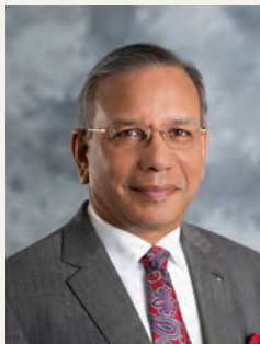
К. Р. РАВИНДРАН, ПРЕЗИДЕНТ, РОТАРИ ИНТЕРНЕТЪНЪЛ